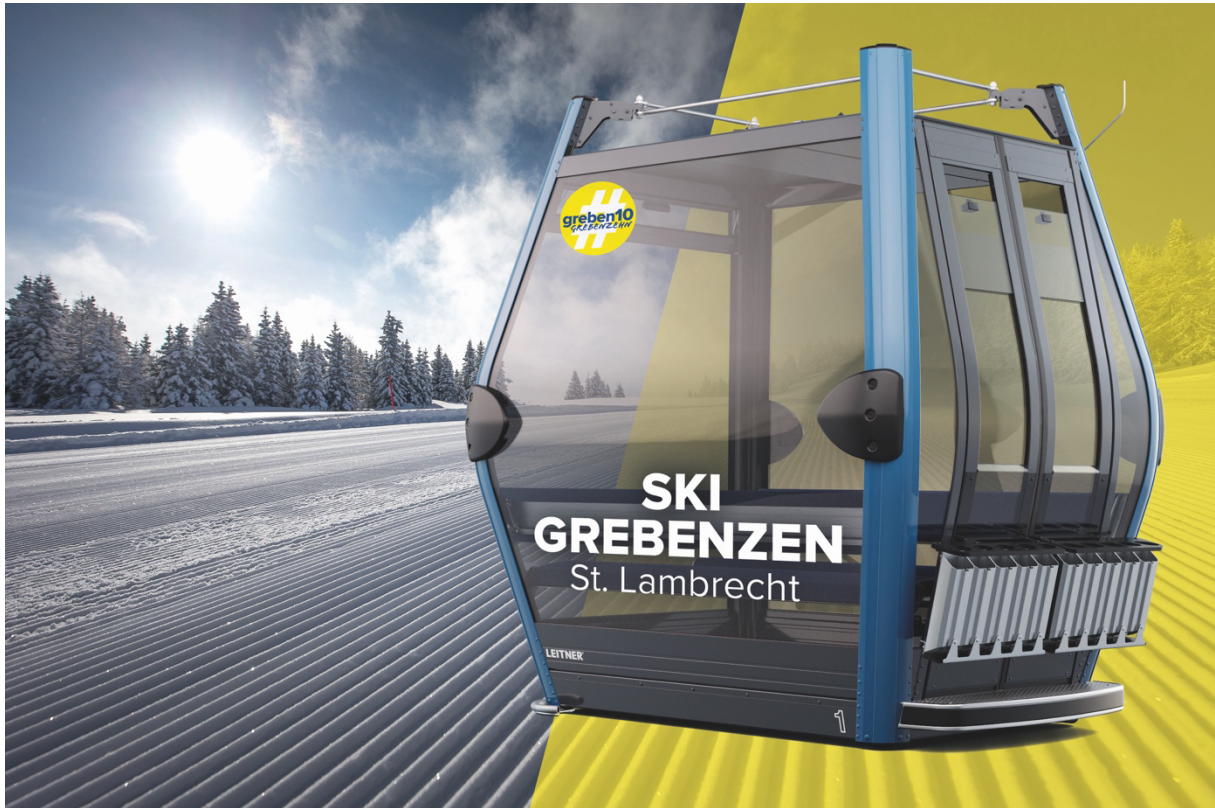
Eine neue Ära beginnt auf der Grebenzen mit der neuen 10er-Gondelbahn diesen Winter.