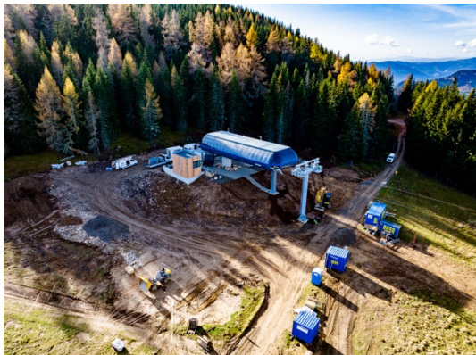
Der aktuelle Baufortschritt an der Bergstation. Foto vom 2.11.2022