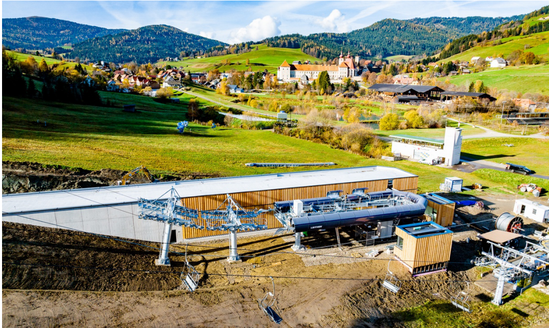
Auf der Grebenzen neigen sich die Bauarbeiten dem Ende zu. Nun gilt es die neue Gondelbahn seilbahntechnisch fertig zu stellen.

Das Gesamtinvestment von 14 Millionen Euro, in den Saisons 22/23 und 23/24, fließt zum einen in den Gondelbau inkl. Berg- und Talstation, mit allen dazugehörigen Gewerken und Arbeiten. Für die Saison 22/23 ist zum anderen eine Pistenerweiterung inkl. Erweiterung der Beschneiungsanlage geplant. Die neue Piste wird über Maria Schönanger führen und mündet dann wieder in den Zielhang und rundet so das breite Pistenangebot auf der Grebenzen weiter ab.