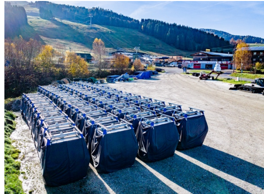
Einige der 55 Gondeln stehen schon bereit für ihren Einsatz ab ca. 21. Dezember.